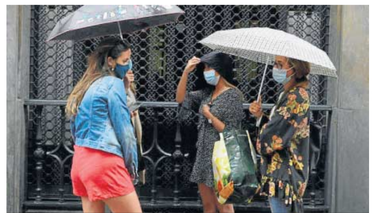
Varias jóvenes con paraguas en Sevilla.

De otro lado, Sevilla ha registrado 28,5 grados en julio, 0,2 grados más que en el mismo mes del año anterior, y 28,6 en agosto, 0,5 grados más. En cuanto a precipitaciones, en julio apenas han caído 0,3 litros por metro cuadrado, un 12% de la cantidad media que cayó en julio de 2020 o un 88% menos; mientras que en agosto no hubo precipitaciones en Sevilla.